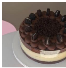
Naked formato express: duas massas e uma camada de recheio